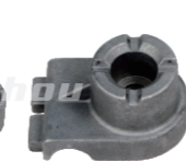
名称: 固定座F NO:GDZ001