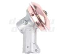
名称: 工作头D(紫铜) WORKING HEAD D NO:8054-1