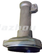
名称: 连接盘I NO:LJP001