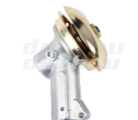
名称: 工作头D(黄铜) WORKING HEAD D NO:8054-2