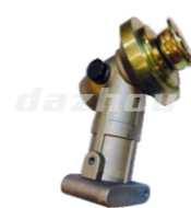
名称: 工作头T WORKING HEAD T NO:GZT009