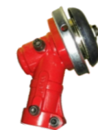
名称: 工作头E1 WORKING HEAD E1 NO:GZT026