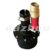
名称: 塑料吸水泵 PLASTIC WATER SUCTION PUMP NO:8093