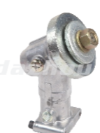
名称: 工作头Z WORKING HEAD Z NO:GZT021