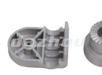
名称: 固定座F(下座) NO:GDZ003