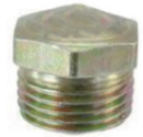
名称:BN45 工作头螺丝 SCREW HEAD B45 NO: B45-025-2