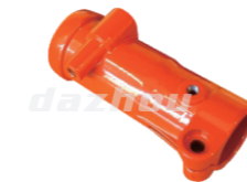
名称: 连接套A CONNECTING PIPE A NO:8080