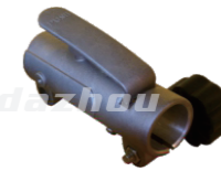
名称: 连接套D CONNECTING PIPE D NO:8082