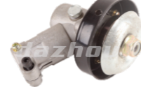
名称: 工作头I WORKING HEAD I NO:8073