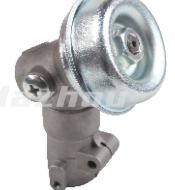
名称: 工作头D1 WORKING HEAD D1 NO:GZT025