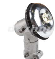
名称: 工作头X WORKING HEAD X NO:GZT019