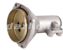
名称: 连接盘F CONNECTOR F NO:8091