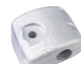
名称: 长筒固定座 THEIR FIXING SEAT NO: