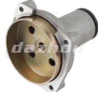
名称: 连接盘H CONNECTOR H NO:8201