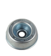
名称: STL450工作头保护盖 GEAR CASE COVER NO:GZT028-1