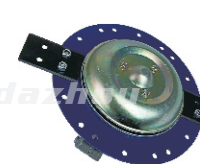
名称:工作头U WORKING HEAD U NO:GZT002