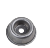
名称: 凯姿工作头保护盖 GEAR CASE COVER NO:GZT030-1