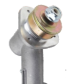
名称: 工作头G1 WORKING HEAD G1 NO:GZT038