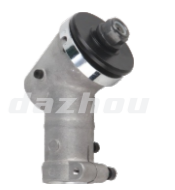
名称: HUS工作头 HUS WORKING HEAD NO:GZT029