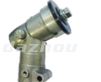
名称: 工作头Q WORKING HEAD Q NO:GZT006