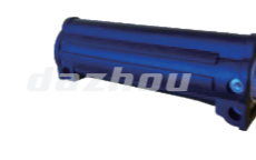
名称: 连接套F CONNECTING PIPE F NO:8084