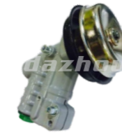
名称: 工作头V WORKING HEAD V NO:GZT010