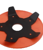
名称: 水稻田割草器 PADDY FIELD WEEDER NO:GZT040