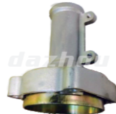
名称: 连接盘J NO:LJP002