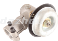
名称: 工作头L WORKING HEAD L NO:8076