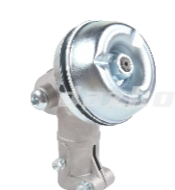
名称: 工作头A1(本田款) WORKING HEAD A1 NO:GZT022