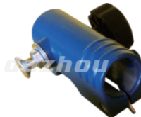
名称: 连接套B CONNECTING PIPE B NO:8081