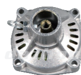
名称: 连接盘P NO:LJP018