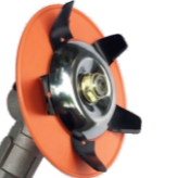
名称: 水稻田割草器总成 PADDY FIELD WEEDER NO:GZT039