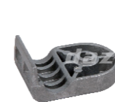
名称: 固定座E NO:GDZ010