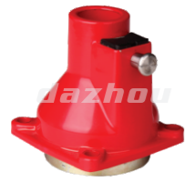
名称: 连接盘A(采茶机) CONNECTOR A (TEA HARVESTER) NO:8088