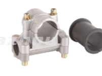
名称: 固定座B FIXING SEAT B NO:8011