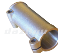
名称: 连接套C CONNECTING PIPE C No:8056