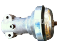
名称: 工作头M WORKING HEAD M NO:8077