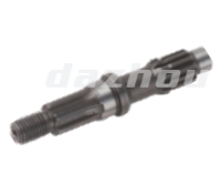
名称:花键轴 SPLINE SHAFT NO:8014-1