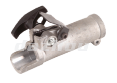
名称: 连接套E CONNECTING PIPE E NO:8083