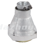
名称: 连接盘N NO:LJP006