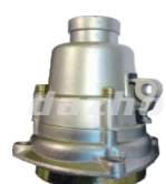
名称: 连接盘L NO:LJP004