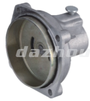
名称: 连接盘B(割草机) CONNECTOR B NO:8050