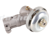
名称: 工作头K WORKING HEAD K NO:8075