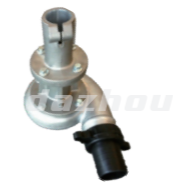
名称: 铝吸水泵 ALUMINUM WATER SUCTION PUMP NO:8094