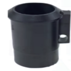
名称:RBC411衬套 NO: 8020-C