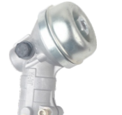
名称: 韩国款工作头 HG WORKING HEAD NO:GZT034