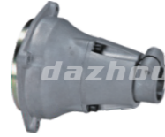
名称: 连接盘C CONNECTOR C NO:8013