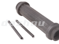
名称: 连接套G CONNECTING PIPE G NO:8085