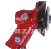
名称: 罗宾款工作头 HUS WORKING HEAD NO:GZT032