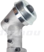
名称: 胡斯华纳工作头 WORKING HEAD NO:GZT031