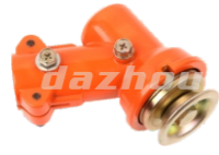
名称: 工作头H WORKING HEAD H NO:8072