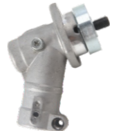
名称: 小号小松工作头 WORKING HEAD A1 NO:GZT027