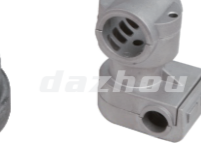
名称: 固定座F(上座) NO:GDZ002