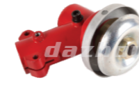
名称: 工作头J WORKING HEAD J NO:8074