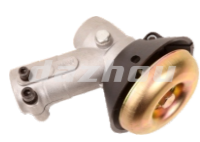
名称: 工作头G(小松) WORKING HEAD G NO:8071