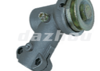
名称:工作头O WORKING HEAD O NO:GZT001