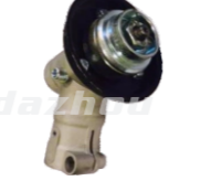
名称: 工作头R WORKING HEAD R NO:GZT007