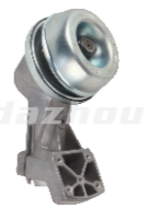
名称: STL450工作头 WORKING HEAD NO:GZT028