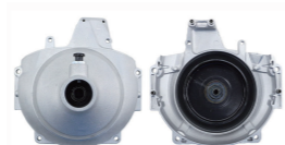
名称: 443R背负式离合器总成 NO:LJP030