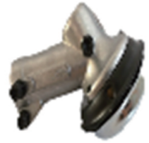
名称:411工作头 WORKING HEAD NO: GZT307