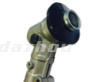
名称: 工作头P WORKING HEAD P NO:GZT005