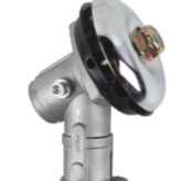
名称: 工作头H1 WORKING HEAD H1 NO:GZT041