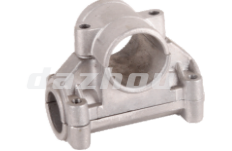
名称: 固定座C FIXING SEAT C NO:8086