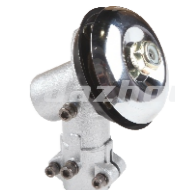
名称: 工作头Y WORKING HEAD Y NO:GZT020