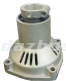
名称: 连接盘K NO:LJP003