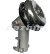
名称: 工作头C1 WORKING HEAD C1 NO:GZT024