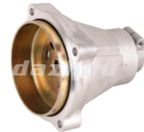
名称: 连接盘G CONNECTOR G NO:8092