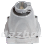
名称: 连接盘R NO:LJP020