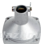
名称: 连接盘S NO:LJP021