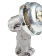
名称: 工作头W WORKING HEAD W NO:GZT018