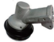
名称:工作头D (黑铜) NO:8054-3