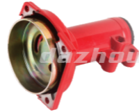
名称: 连接盘E CONNECTOR E NO:8090