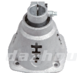
名称: 连接盘Q NO:LJP019