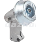
名称: 工作头B1(胡斯华纳) WORKING HEAD B1(HUS) NO:GZT023