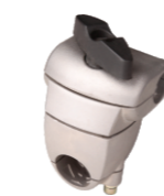
名称: 斯蒂尔固定座 STIHL FIXING SEAT NO:8055