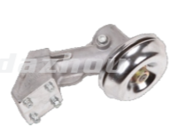
名称: 工作头(斯蒂尔120) WORKING HEAD(ST120) NO:8078