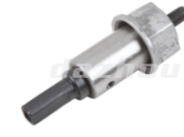
名称: 弯管工作头 WORKING HEAD NO:8266