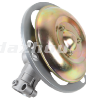
名称: 大盘齿轮箱 WORKING HEAD NO:8202