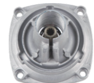
名称: 胡斯华纳连接盘 NO:LJP022