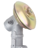
名称: 工作头F1 WORKING HEAD F1 NO:GZT033