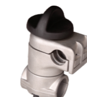
名称: 胡斯华纳固定座 HUS FIXING SEAT NO:8079