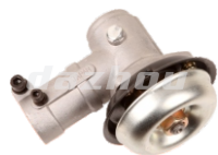
名称: 工作头F(90°) WORKING HEAD F NO:8070