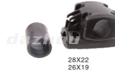
名称: 固定座A(塑料) FIXING SEAT A No:8010