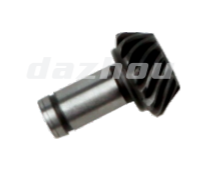
名称:伞形齿轮 BEVEL GEAR NO:8014-2