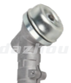
名称: 凯姿款工作头 WORKING HEAD NO:GZT030