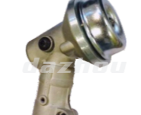
名称: 工作头S WORKING HEAD S NO:GZT008