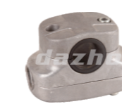
名称: 固定座D FIXING SEAT D NO:8087