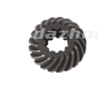
名称:大齿轮 BIG GEAR WHEEL NO:8014-3