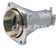
名称: 连接盘M NO:LJP005