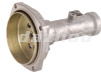
名称: 连接盘D CONNECTOR D NO:8089