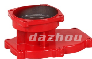
名称:上箱体 CRANK CASE NO:DZ0008