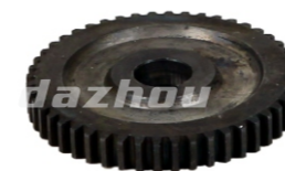
名称:48齿(齿轮) 48T GEAR NO:DZ0023