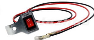
名称:熄火开关总成 STOP SWITCH ASSY NO:DZ0006