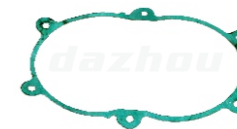
名称:箱体纸垫 CRANK CASE GASKET NO:DZ0025