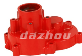
名称:下箱体 CRANK CASE NO:DZ0009