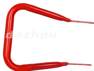
名称:左手把 LEFT HANDLE NO:DZ0001