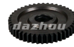
名称:44齿(齿轮) 44T GEAR NO:DZ0024