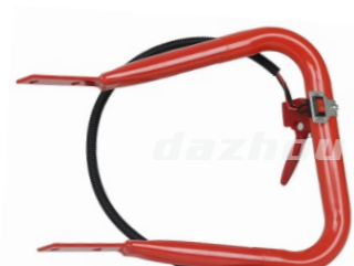
名称:右手把 RIGHT HANDLE NO:DZ0002