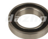
名称:6905轴承 6905 BEARING NO:DZ0021