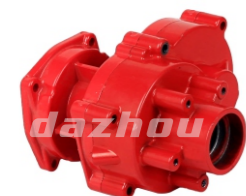
名称:箱体总成 CRANK CASE ASSY NO:DZ0007