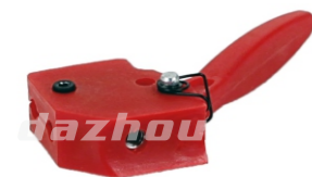
名称:油门开关 THROTTLE LEVER NO:DZ0003