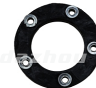
名称:减震垫 DAMPER WASHER NO:DZ0013