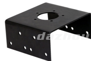
名称:支架 SUPPORTER NO:DZ0010