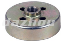
名称:被动盘 CLUTCH DRUM NO:DZ0014