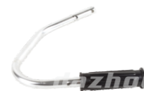
名称: 把手 HANDLE NO:TH012