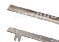
名称: 压条 BATTEN NO:THS041