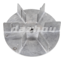
名称: 风叶轮 THE WIND IMPELLER THT003