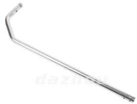
名称: 铝管 PIPE(AL) NO:TH006