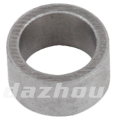
名称: 衬套 LINING THT021