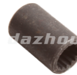
名称: 连接轴 CONNECTING SHAFT NO:THS021