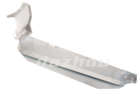
名称: 挡叶板 PROTECTOR NO:TH005