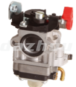
名称: 化油器 CARBURETOR NO:THS008