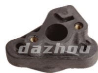
名称: 进气管 INTAKE MANIFOLD NO:THS018