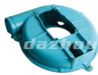
名称: 风箱 FAN CASE NO:THS002