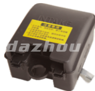
名称: 空滤器 AIR FILTER NO:THS007