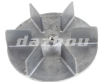
名称: 风叶轮 FAN BLADE NO:TH003