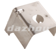
名称: 缸体隔热板 INSULATOR CYLINDER NO:THS026