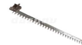
名称: 单刃刀片 SINGLE EDGE BLADE NO:THS034