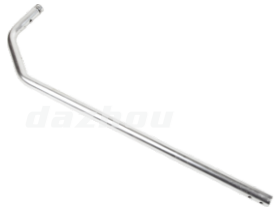
名称: 铝管 PIPE(AL) NO:THT006