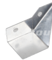
名称: 刀片支架 BLADE SUPPORT THT018