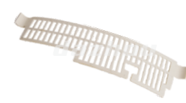
名称: 挡杂板 PLATE NO:THS035