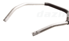
名称: 小把手 LITTLE HANDLE NO:THS005