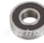
名称: 轴承6200 BEARING 6200 NO:TH020