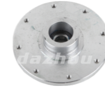
名称: 铝连接座 CONNECTING SEAT (AL) THT015