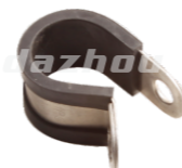
名称: 手把固定座 HANDLE FIXED SEAT NO:THS020