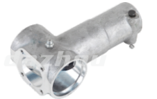
名称: 旋转座 ROTARY SEAT THT017