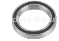
名称: 轴承 BEARING THT024