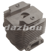
名称: 气缸 CYLINDER NO:THS012