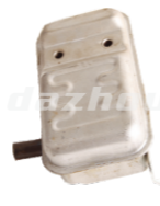
名称: 消音器 MUFFLER NO:THS015