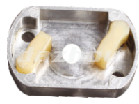
名称: 拨盘 PULLEY NO:THS011