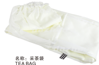
名称: 采茶袋 TEA BAG NO:THT025