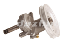
名称: 齿轮箱 GEAR CASE NO:THS017