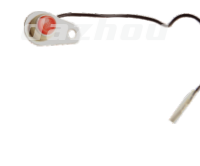
名称: 熄火开关 STOP SWITCH NO:THS030