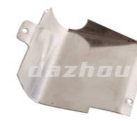
名称: 隔热板 INSULATOR NO:THS027