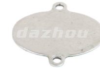
名称: 盖 CAP NO:TH023