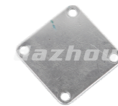
名称: 压盖 GLAND THT022