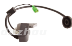
名称: 高压包 IGNITION COIL NO:THS014