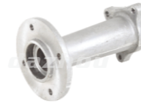
名称: 连接座 CONNECTING SEAT NO:TH014