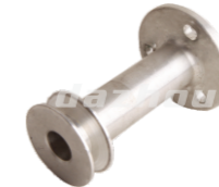
名称: 皮带轮 PULLEY NO:THS023