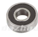
名称: 轴承608 BEARING 608 NO:TH021