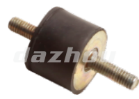
名称: 减震脚 ANTI-VIBRATION PIN NO:THS016