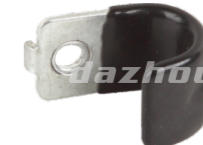
名称: 挂钩 HOOK NO:TH024