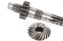
名称: 伞齿 GEAR NO:TH016