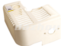
名称: 缸体罩 CYLINDER COVER NO:THS004