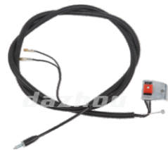
名称: 开关总成 STOP SWITCH ASSY NO:THT011