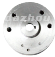
名称: 磁飞轮 FLYWHEEL NO:THS013