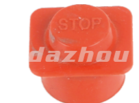
名称: 防护帽 ANTI-TWIST CAP NO:TH028