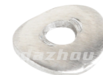
名称: 弧线垫片 CURVE GASKET NO:TH027