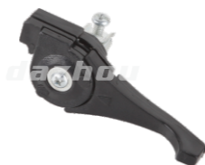
名称: 油门开关 THROTTLE LEVER NO:THT013