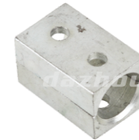
名称: 手把固定 HANDLE FIXED THT016