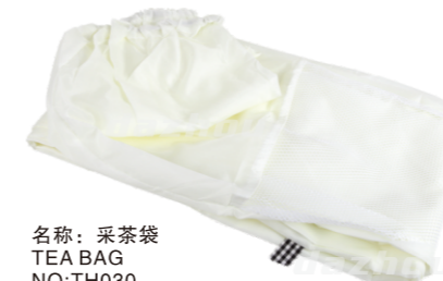
名称: 采茶袋 TEA BAG NO:TH030