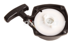
名称: 启动器 STARTER NO:THS006