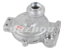
名称: 齿轮箱体 GEAR CASE NO:THT002