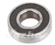
名称: 轴承6201 BEARING 6201 NO:TH019