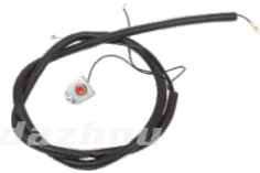
名称: 开关总成 STOP SWITCH ASSY NO:TH011