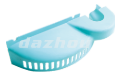
名称: 护罩 COVER NO:THS001