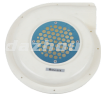
名称: 风箱 AIR BELLOW THT001