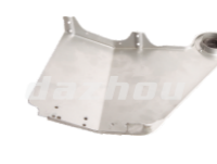
名称: 连接板 CONNECTING PLATE NO:THS028