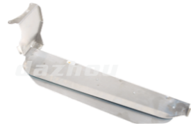
名称: 挡叶板 PROTECTOR NO:THT005