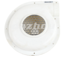
名称: 风箱 FAN CASE NO:TH001