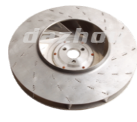
名称: 风叶 FAN BLADE NO:THS009