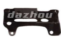
名称: 油壶支架 TANK SUPPORT NO:THS019