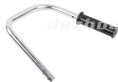
名称: 把手 HANDLE NO:THT012