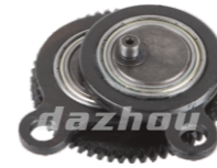
名称: 偏心齿轮 ECCENTRIC GEAR THT014