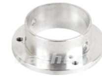
名称: 铝座 SEAT (AL) NO:TH018