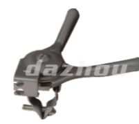
名称: 多用开关 MULTI-PURPOSE SWITCH NO:THS010