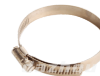
名称: 扣箍 BUCKLE NO:THS036