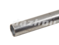
名称: 套管 CASING PIPE NO:MPM-028