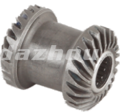
名称: 双头齿轮 DOUBLE TOP GEAR NO:MPM-047