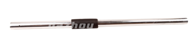
名称: 铝管 ALUMINIUM PIPE NO:MPM-031