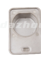
名称: 箱体后座 BACKSEAT (CRANKCASE) NO:MPM-018