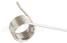
名称: 扭簧 SPRING NO:MPM-043