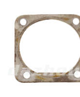
名称: 箱体后座垫 CRANKCASE GASKET NO:MPM-019