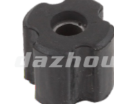
名称: 含油轴承 OIL BEARING NO:MPM-027