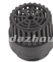
名称: 水花篮 FILTER NO:MPM-066