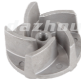
名称: 叶轮 VANE WHEEL NO:MPM-061