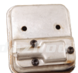
名称: 消声器 MUFFLER NO:MPM-006