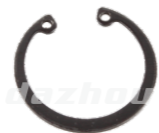
名称: 卡簧 φ26 SNAP RING NO:MPM-055