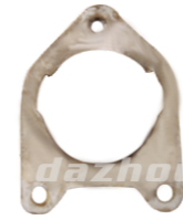
名称: 气缸纸垫 CYLINDER GASKET NO:MPM-016