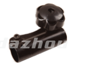
名称: 快接 CONNECTION NO:MPM-025