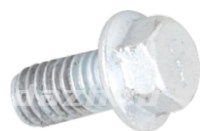
名称: 法兰螺丝 SCREW NO:MPM-072