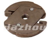
名称: 离合器 CLUTCH NO:MPM-010