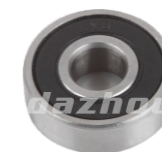
名称: 轴承 608 BEARING 608 NO:MPM-067