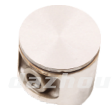
名称: 活塞 PISTON NO:MPM-011