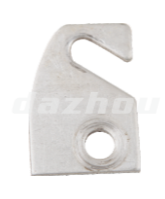
名称: 油门线固定座 THROTTLE LINE FIXED SEAT NO:MPM-017