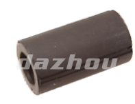
名称: 连接套 CONNECTING PIPE NO:MPM-029