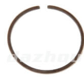
名称: 活塞环 PISTON RING NO:MPM-012