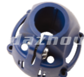
名称: 被动盘壳体 PASSIVE DISC CASE NO:MPM-003