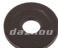
名称: 平垫 GASKET NO:MPM-050