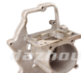
名称: 箱体 CRANKCASE NO:MPM-005