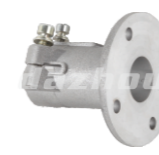
名称: 连接座 CONNECTION SEAT NO:MPM-062