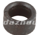
名称: 轴套 SHAFT SLEEVE NO:MPM-048