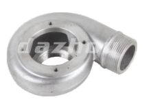
名称: 泵体 PUMP NO:MPM-064