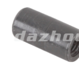
名称: 接头 ADAPTER CONNECTOR NO:MPM-070