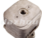
名称: 气缸 CYLINDER NO:MPM-008