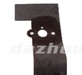
名称: 化油器垫片 CARBURETOR GASKET NO:MPM-022