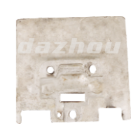
名称: 挡热板 BAFFLE NO:MPM-020