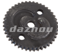
名称: 偏心齿轮 ECCENTRIC GEAR NO:MPM-040