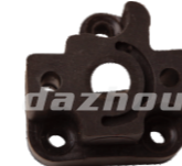
名称: 进气管 MANIFOLD NO:MPM-026