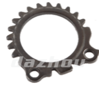
名称: 调节角度齿轮 ANGLE ADJUST GEAR NO:MPM-041