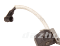
名称: 高压包 IGNITION COIL NO:MPM-014