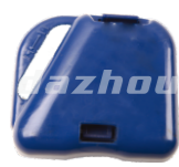
名称: 空滤器 AIR FILTER NO:MPM-001