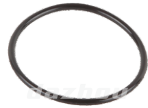
名称: O型圈 ORING NO:MPM-033