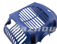
名称: 缸体罩B CYLINDER COVER B NO:MPM-004