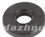
名称: 油封 OIL SEAL NO:MPM-069