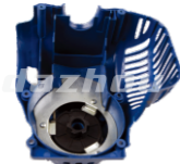
名称: 缸体罩A CYLINDER COVER A NO:MPM-002