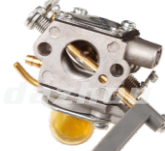
名称: 化油器 CARBURETOR NO:MPM-007