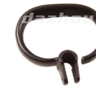
名称: 前手把 HANDLE,FRONT NO:MPM-024