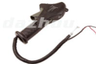
名称: 鱼头开关 THROTTLE LEVER NO:MPM-023