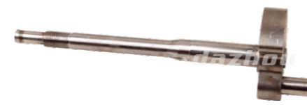
名称: 曲轴 CRANKSHAFT NO:MPM-030