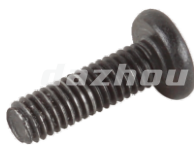
名称: 大平头螺丝 SCREW 6*25 NO:MPM-052