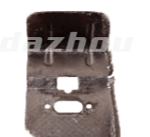
名称: 消声器隔热垫 MUFFLER INSULATION NO:MPM-015