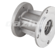
名称: 固定座 FIXED SEAT NO:MPM-063