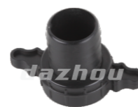
名称: 塑料扳手 PLASTIC SPANNER NO:MPM-065