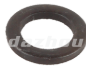
名称: 垫片 GASKET NO:MPM-049