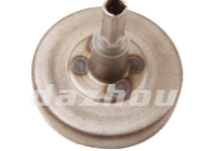
名称: 离合碟 CLUTCH DRUM NO:MPM-009