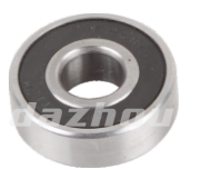
名称: 轴承6201 BEARING6201 NO:MPM-068