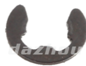
名称: 开口卡簧 E-CLIP φ26 NO:MPM-056